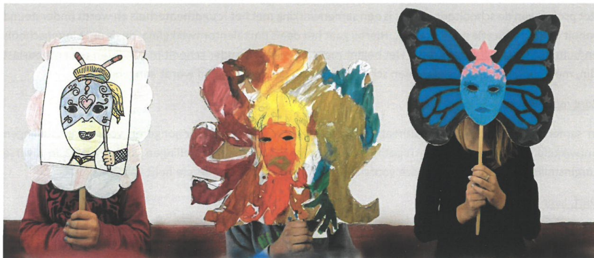
Kinderen met maskers gemaakt tijdens de cursus TenS