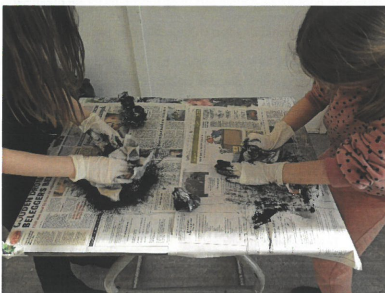
Cursus Waanzinnig Druk